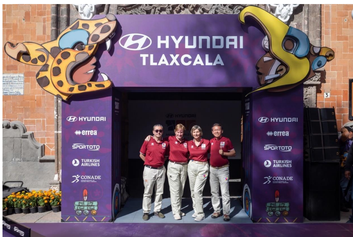
Final de la Copa del Mundo 2022