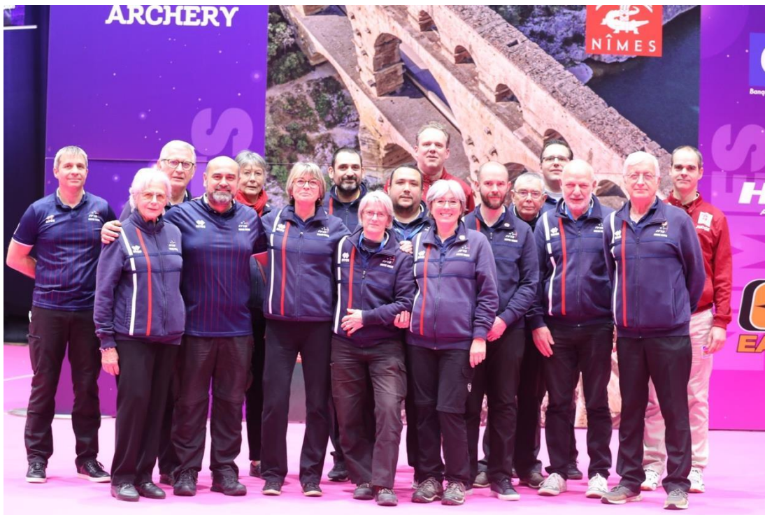
Nîmes 2023, Series Mundiales de Sala