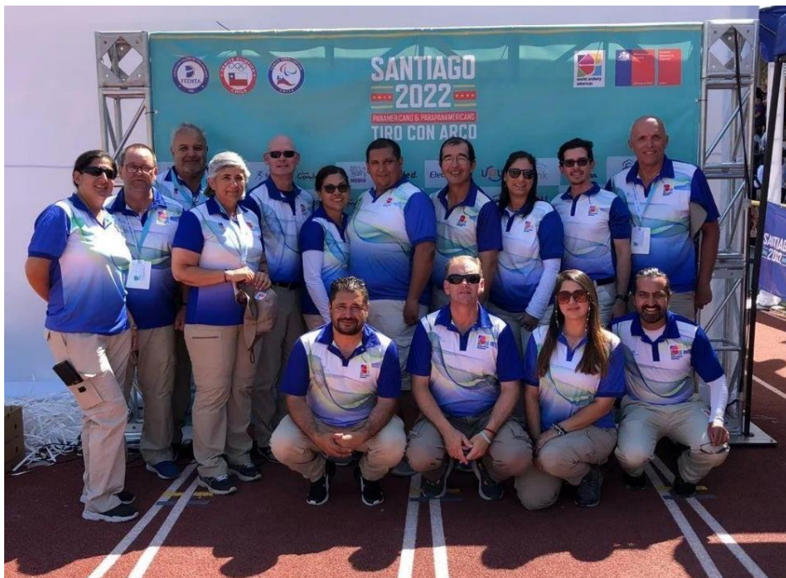
Santiago de Chile, Campeonatos Panamericanos 2022