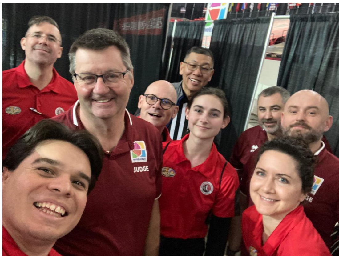
Las Vegas 2023, Finales de las Series Mundiales de Sala