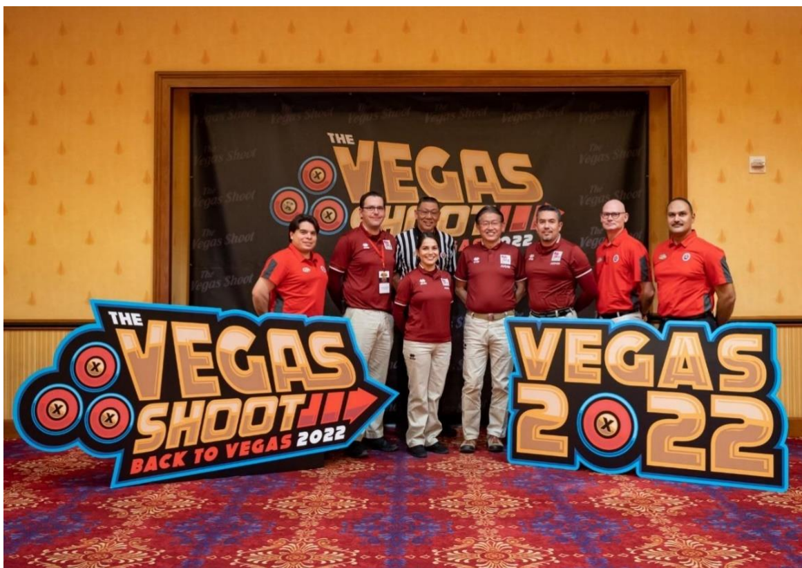
Series Mundiales de Sala – Etapa 2 – Las Vegas