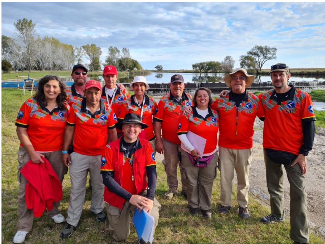
Suramérica Campeonatos Libres 3D – Argentina