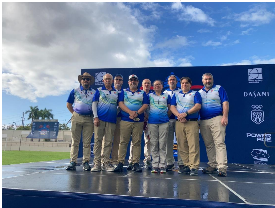
Copa Puerto Rico – Evento de Clasificación Mundial, Bayamón, Puerto Rico