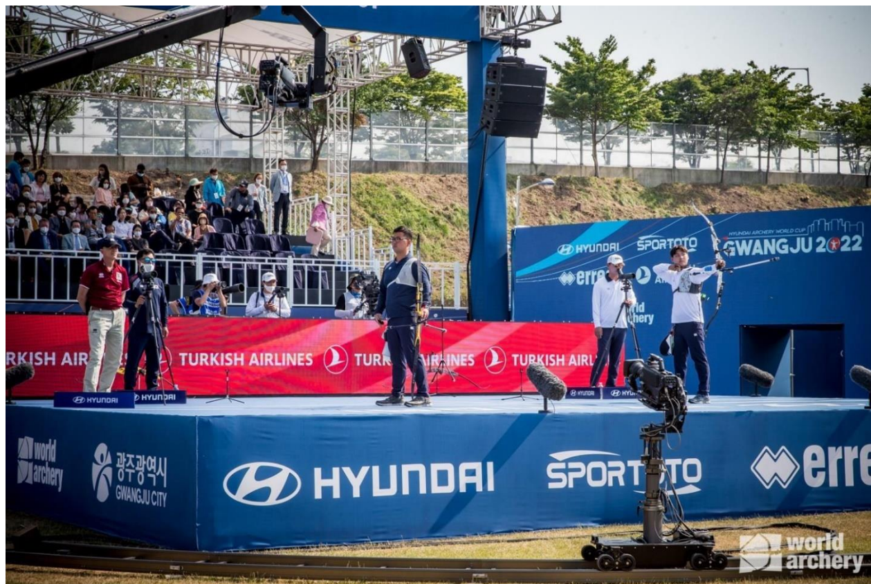
Dos arqueros coreanos con diferentes uniformes en el mismo encuentro

encuentros de cuartos de final (y sepamos quiénes tirarán las finales) si tienen los dos juegos de uniformes requeridos.