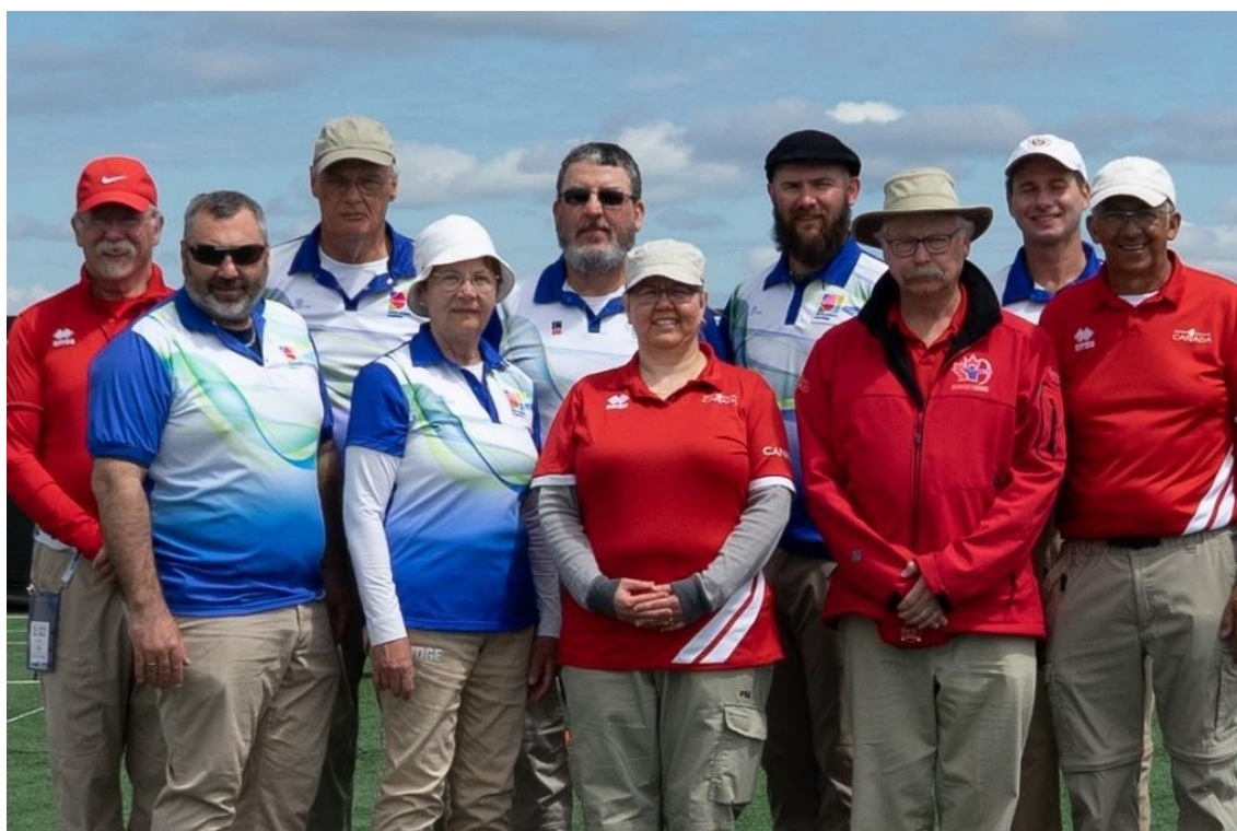
Campeonatos Panamericanos Juveniles y Veteranos, Halifax, Canadá