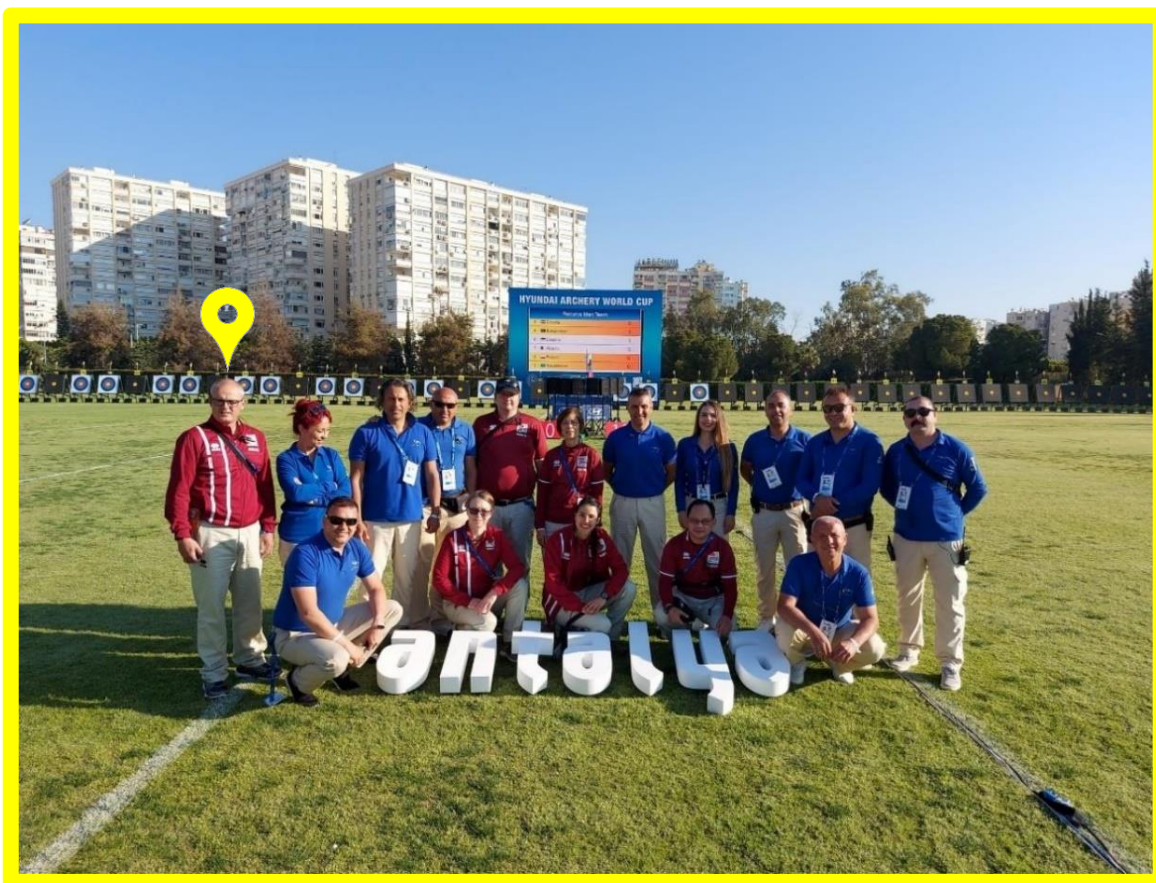
Copa Hyundai de World Archery, Etapa 1 – Antalya, Turquía