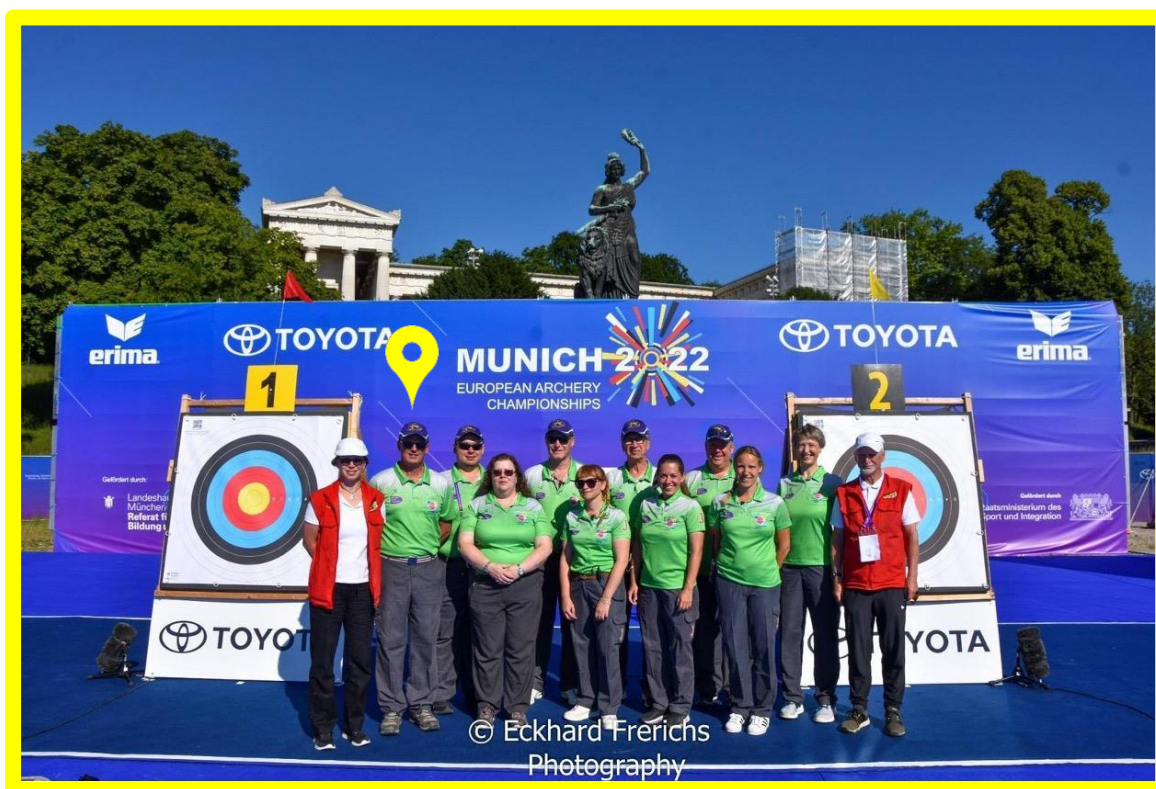
Campeonatos Europeos, Múnich, Alemania