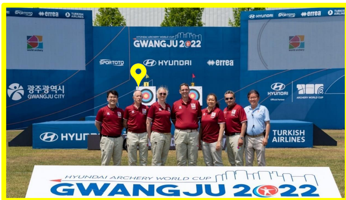
Copa Hyundai de World Archery, Etapa 2 – Gwangju, Corea del Sur